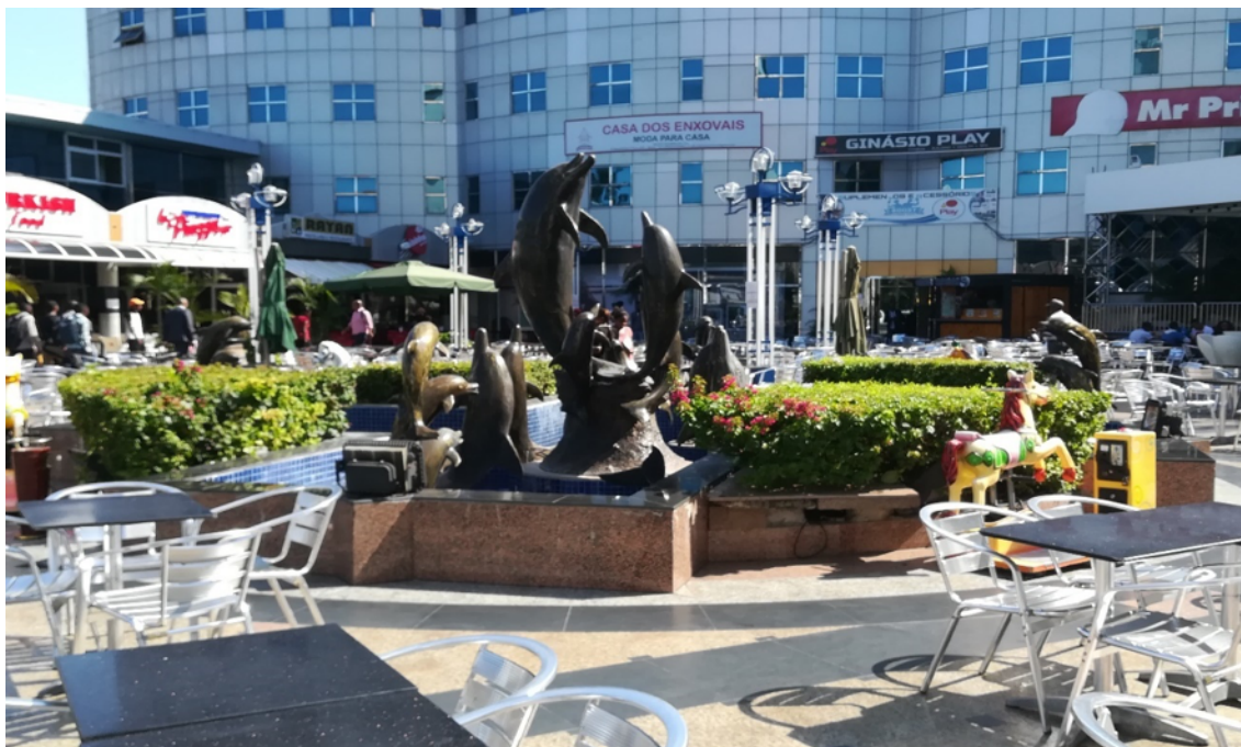
Zona exterior do Shopping de Maputo com cafés, lojas e um Ginásio