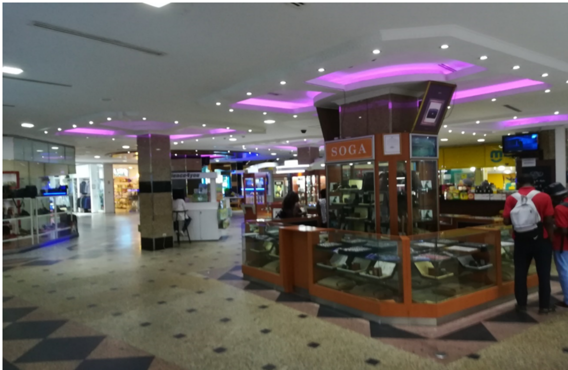
Interior do Maputo Shopping e átrio com muitas lojas