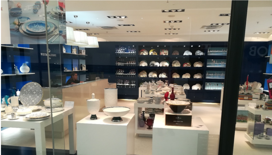
A Loja Vista Alegre no Baía Mall