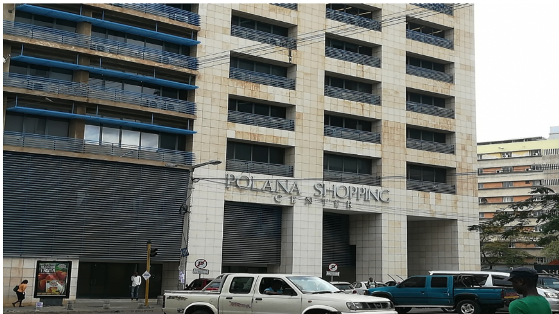
Vista da entrada do Polana Shopping Center

Neste centro encontrará diversas lojas desde Cabeleireiro, casa de Cambio, Balção do Banco IM, Cafés e várias lojas. Gerido pela empresa Teixeira Duarte.