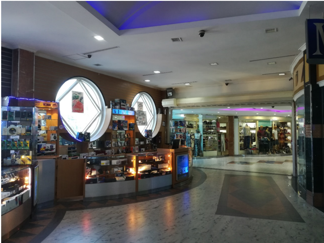
Interior do Centro Comercial Maputo Shopping