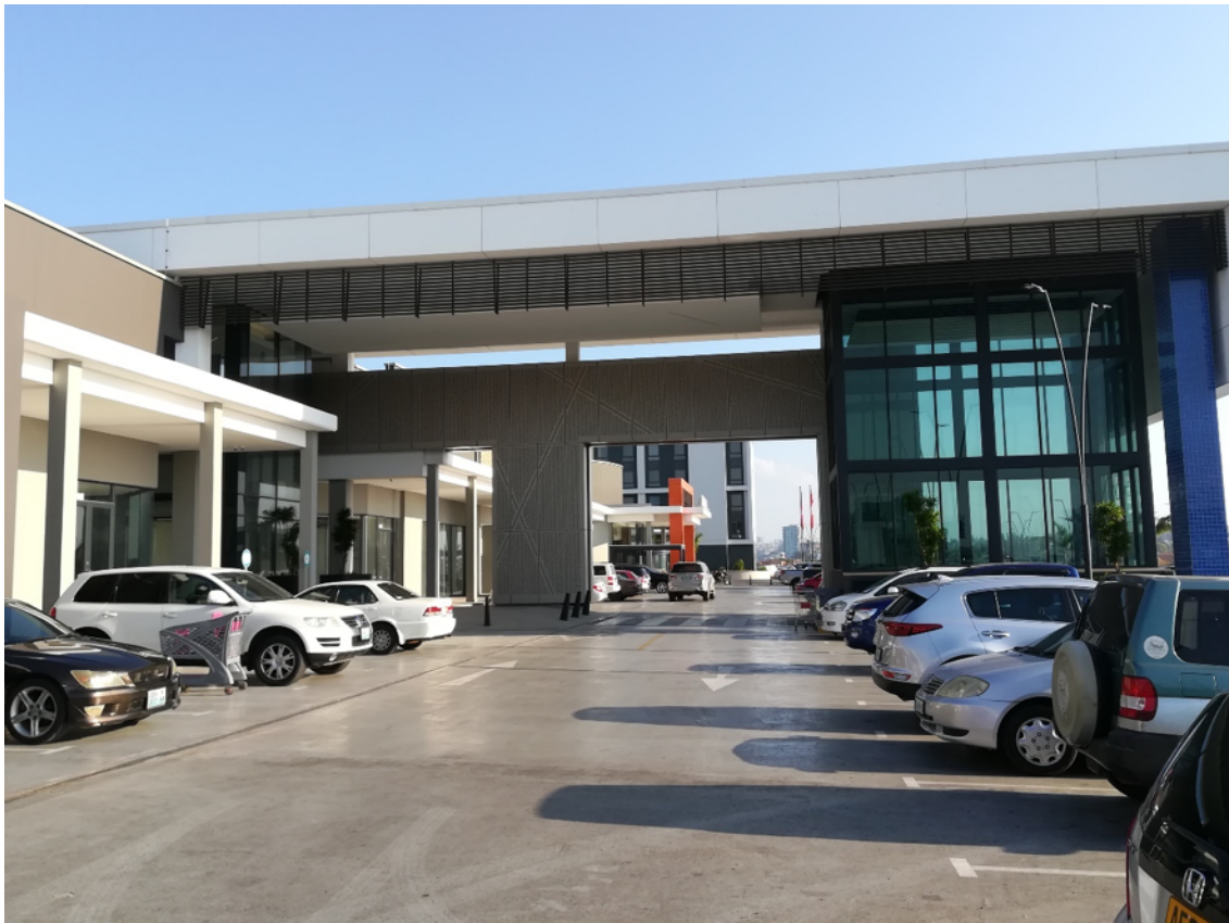
Aspecto da entrada para o Baia Mall