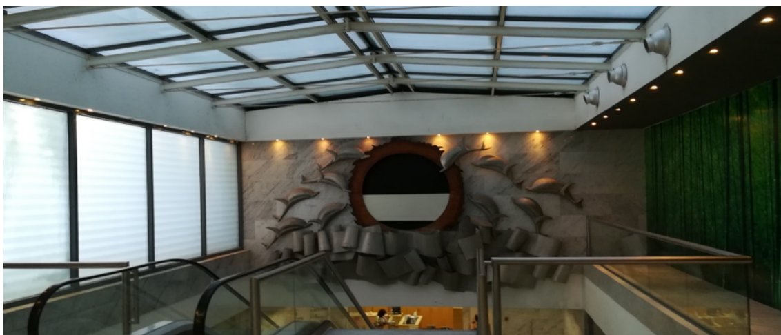
A descida da entrada para o Rés do Chão do Polana