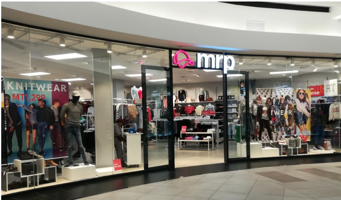
Interior do Centro Comercial vendo-se uma das lojas