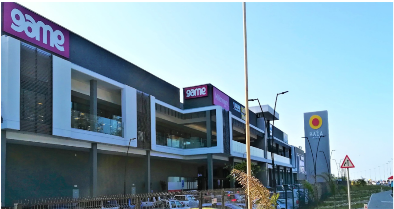
Aspecto do exterior do Centro Comercial Baía Mall

O investimento total atinge os 96 milhões de euros e o projeto deverá criar mais de 2.500 empregos.