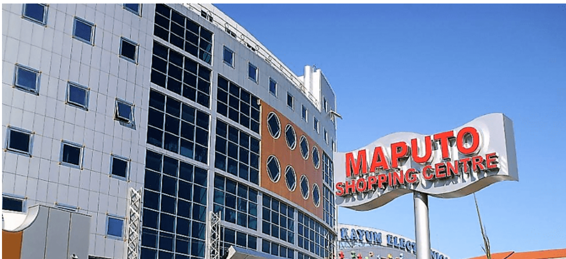
No bairro da Baixa de Maputo junto ao porto da cidade localiza-se este grandioso Shopping.

Situado na rua Ngungunhane em Maputo tem lojas de roupas, joalharias, casa de electrodomésticos, várias lojas de diversos artigos e um grande supermercado. Tem 1 sala de cinema no piso térreo, ginásio e vários cafés. Foi construído por chineses e com materiais do Médio Oriente. Possui uma grande loja de artigos para crianças com o nome de Knu Kids 'r' us.