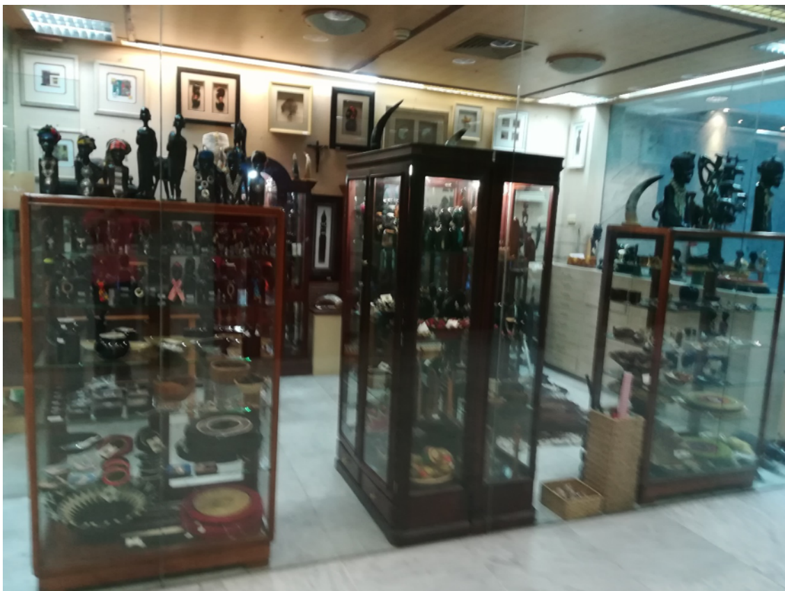
Uma das Lojas de artesanato neste Shopping